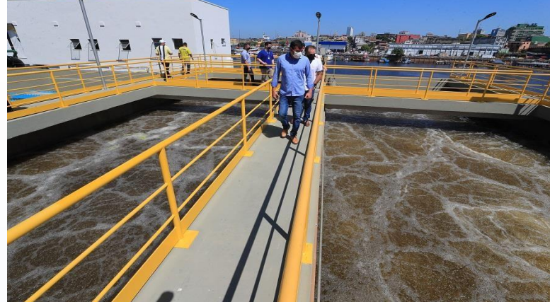
A ETE, localizada às margens do rio Negro, Manaus - AM